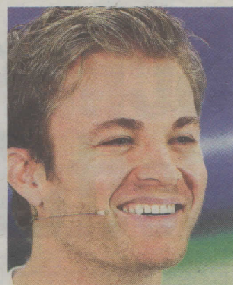
Entspannt: Nico Rosberg