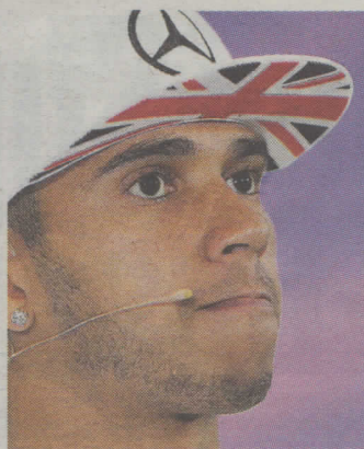
Angespannt: Lewis Hamilton

Ob das nach den Team-Regeln bei Mercedes erlaubt wäre, wollte Rosberg auf Nachfrage gestern nicht sagen. Er schmunzelte nur: „Das ist eine sehr gute Frage.“